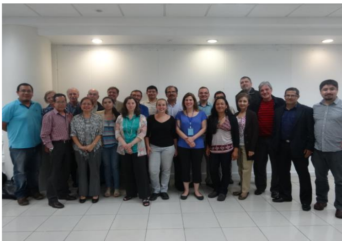
Quelques-uns des participants au colloque « La Fabrique des héros en Amérique Latine (XIX-XXI èmes siècles) ».

En plus des 8 sessions thématiques, le programme prévoyait deux conférences pour inaugurer et clôturer le colloque. Le mercredi après-midi, plusieurs activités académiques ont été organisées en profitant de la venue des participants et avec le soutien de diverses unités académiques de la UCR (Master en Droit Public Comparé Franco-Latinoaméricain, Master Centraméricain d'Histoire et Ecole d'Histoire). L'activité était gratuite et ouverte à tout public, ce qui a favorisé l'assistance notamment d'étudiants et de professeurs d'institutions centraméricaines, enrichissant ainsi le débat. Cette rencontre a également été l'occasion de renforcer les relations entre les institutions françaises et latino-américaines. Le colloque dans son ensemble a été filmé et les vidéos sont diffusées en libre accès sur le site web de la Faculté de Sciences Sociales de la UCR. La publication de textes présentés est également envisagée.