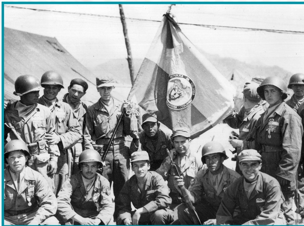
«Soldats du Batallón Colombia en Corée, Avril de 1953».