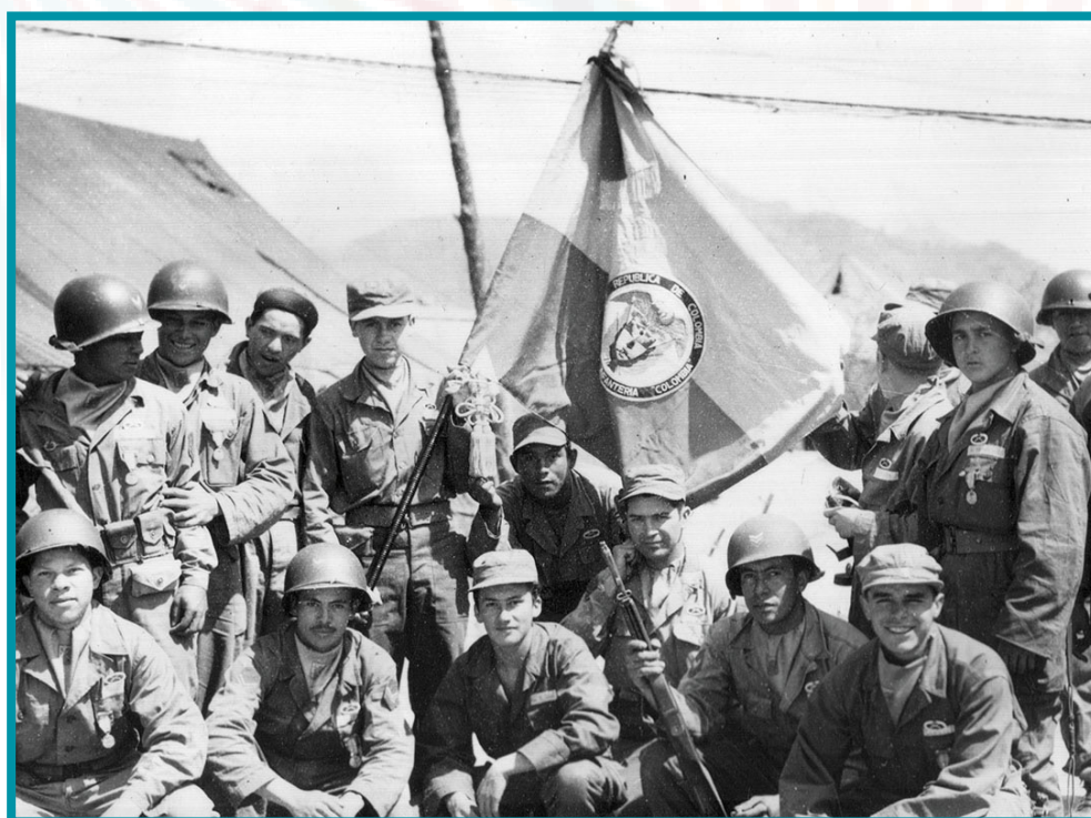
«Soldats du Batallón Colombia en Corée, Avril de 1953».